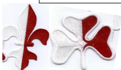
Fleur de Lys (garçon) ou Trèfle (fille)

L'insigne de Groupe se coud de manière verticale, la pointe tournée vers le bas