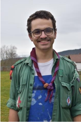
Barasingha responsable de Meute