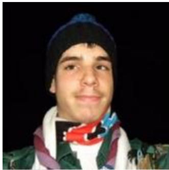
Resp. petit matériel (QM) Phocoéna