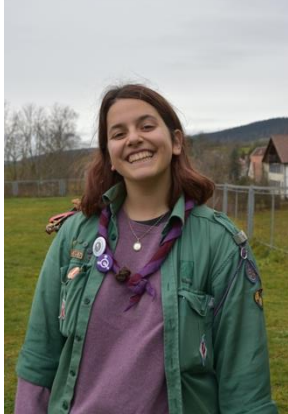
Co-Responsable de Groupe Colibri