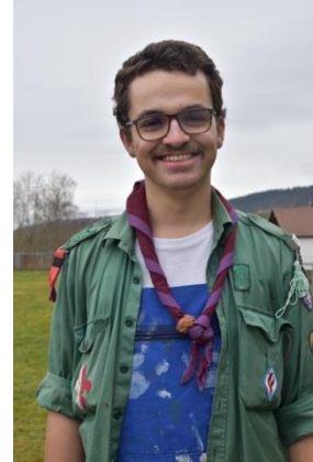
Co-Responsable de Groupe Barasingha