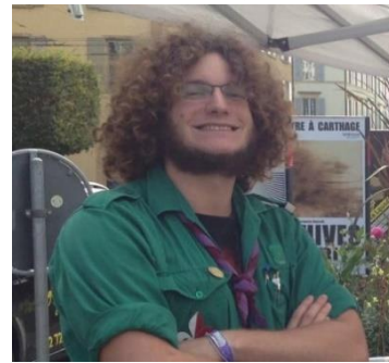
Resp. Gros matériel (QM) Agami